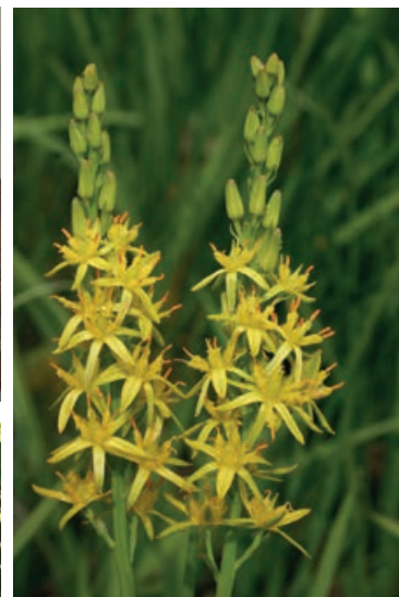
BEENBREEK (NARTHECIUM OSSIFRAGUM)