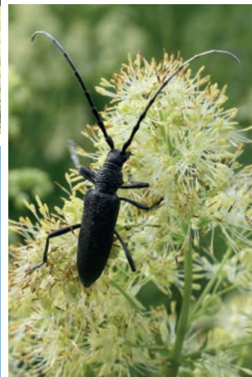
KLEINE EIKENBOKTOR (CERAMBYX SCOPOLI)