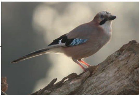
GAAI (GARRULUS GLANDARIUS)