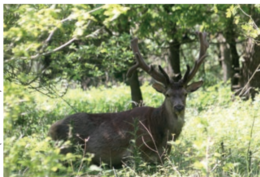
EDELHERT (CERVUS ELAPHUS)